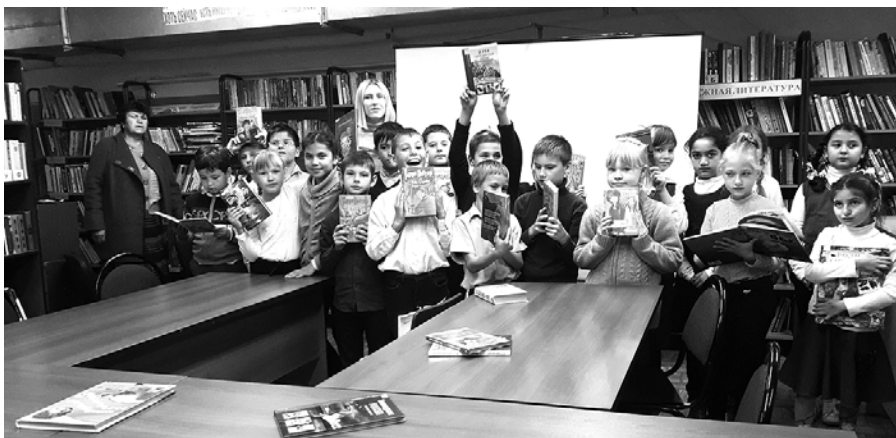
19 ОКТЯБРЯ 2019 ГОДА В ПОСЕЛКОВОЙ БИБЛИОТЕКЕ ПРОШЕЛ КОНКУРС РИСУНКОВ «ГРАЖДАНСКАЯ ОБОРОНА». РЕБЯТА СТАРАЛИСЬ ИЗОБРАЗИТЬ, КАК ОНИ ПОНИМАЮТ, ЧТО ТАКОЕ «ГРАЖДАНСКАЯ ОБОРОНА» И КАК ОНА ВАЖНА. ВОЗРАСТ РЕБЯТ ОТ 4 ДО 9 ЛЕТ.